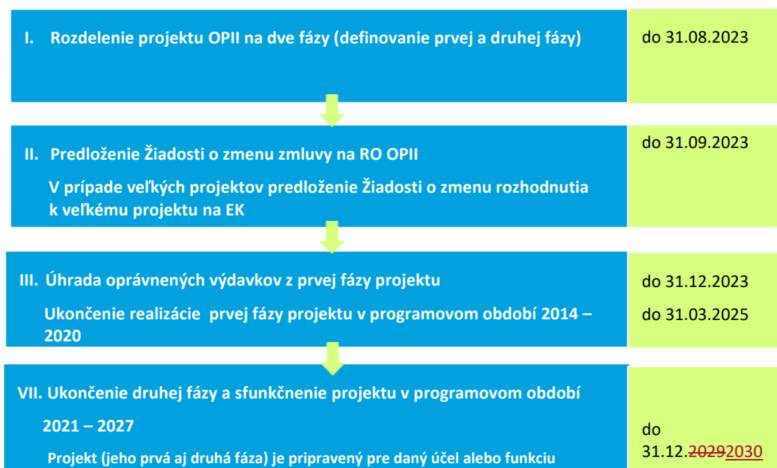
Schéma 1 Proces fážovania projektov (schválené projekty)